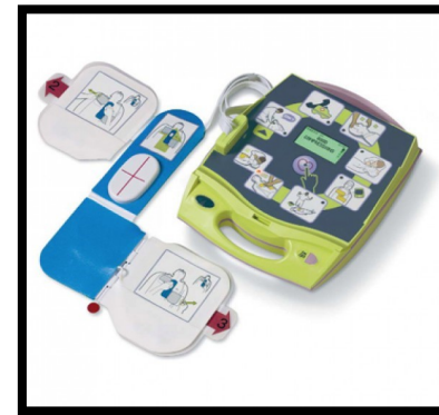
DEA Zoll AED+