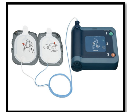
DEA Philips FRX

Coordination des services préhospitaliers d'urgence Direction des services multidisciplinaires