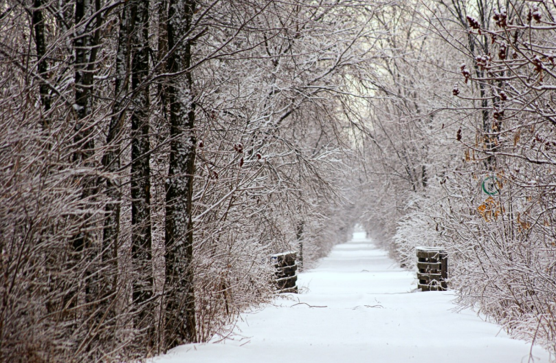
Table de concertation petite enfance de la MRC d'Antoine-Labelle

Vous trouverez en pièce jointe le calendrier des activités prévu pour le mois de mars, conçu spécialement pour les familles avec des enfants de 0 à 5 ans. Nous vous invitons à le partager sur vos réseaux sociaux.