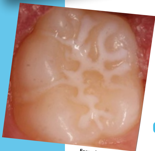
Exemple de dent scellée

L'application du scellant est simple, n'entraîne pas d'effets secondaires et se fait en une seule rencontre de moins d'une heure.