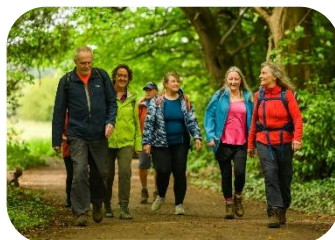
Marcher 10 minutes le midi