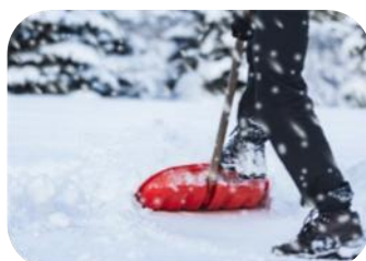
Pelleter la neige