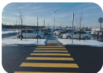
Stationner plus loin volontairement