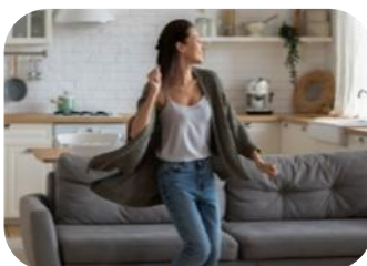
Danser sur votre musique