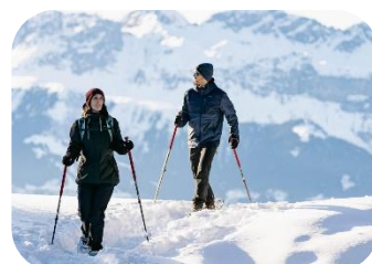
Faire du patin / ski / raquette