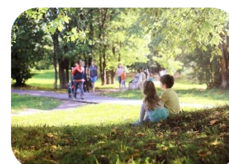
Aller au parc en famille

Invitez vos collègues et cumulez vos minutes en équipe afin de faire grimper la moyenne de votre direction. Ensemble, chaque geste compte !