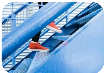
Monter les escaliers

Bouger, c'est souvent plus simple qu'on le pense. Les petites minutes accumulées au fil de la journée comptent vraiment : escaliers, marche, ménage, jeux en famille... tout s'additionne. Cette année, bougeons ensemble et ajoutons un peu plus de mouvements à nos habitudes.