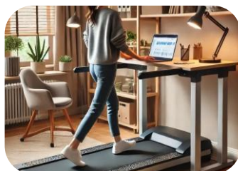
Marcher durant une réunion