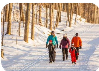
Marcher / Randonnée