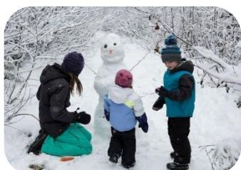
Jouer avec les enfants