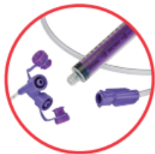
Connecteurs ENFit MC