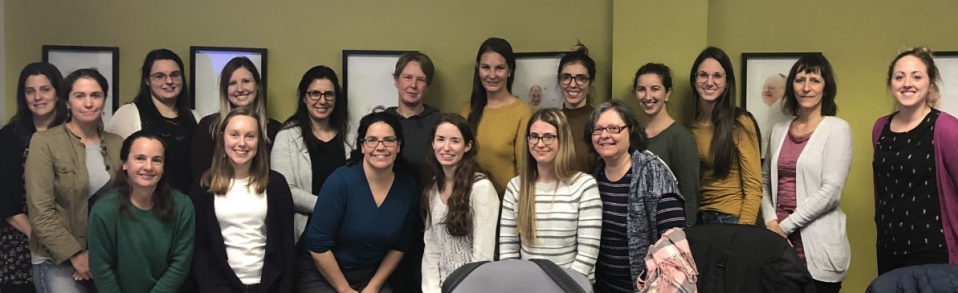
Des superviseuses engagées, mobilisées et au cœur du développement professionnel des stagiaires.